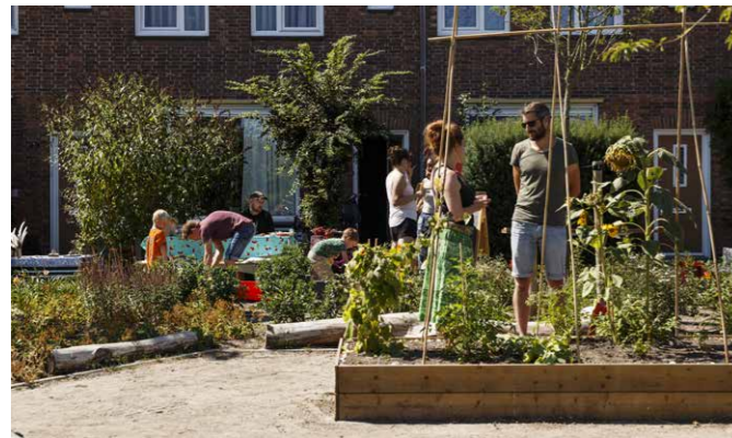
Minahassa Park om de Hoek, aangelegd in 2017