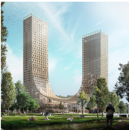
Foto: Nieuw ontwerp 'the Dutch mountains' 2024 in Eindhoven van houtbouw architect Marco Vermeulen

Biobased bouwen is een in opkomst. Met 73 meter en 21 verdiepingen is Haut de grootste houten woontoren in Nederland. Een mooi voorbeeld dat hoogbouw en houtbouw elkaar niet uitsluiten. Ook hotel Jakarta en het nieuwe initiatief 'The Dutch Mountains' tonen aan dat houtbouw een nieuwe, schaalbare trend lijkt te worden.