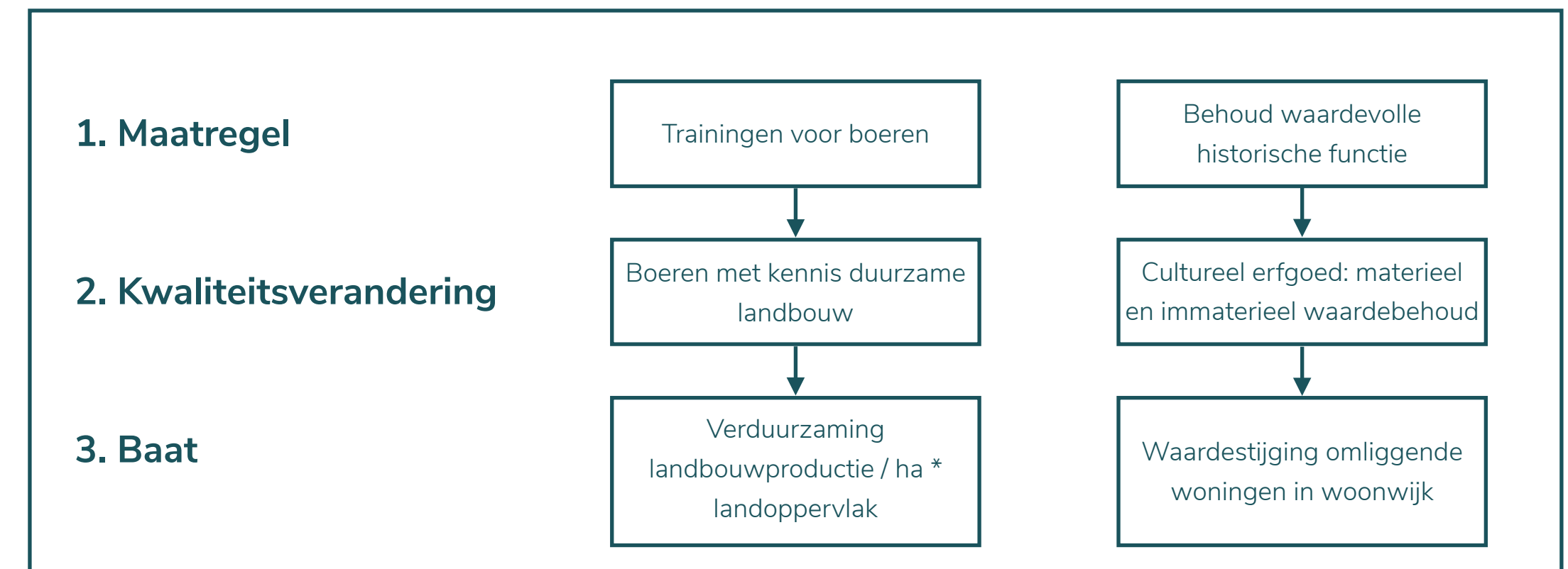
Afbeelding: Potentiële baten De Plaetse (Zuid)